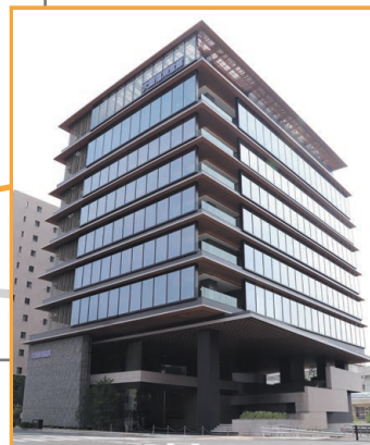
大阪信用金庫 本店

大阪メトロ谷町線「四天王寺前夕陽ヶ丘」駅 北側①出口より東へ徒歩7分 または近鉄「大阪上本町」駅より南へ徒歩12分