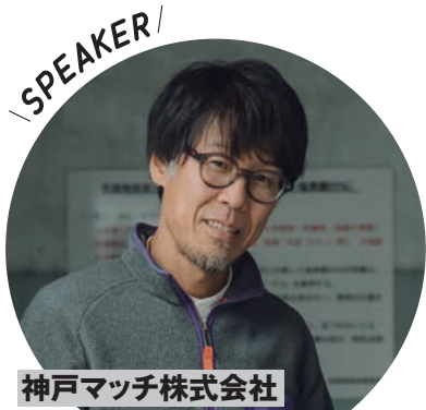
神戸マッチ株式会社