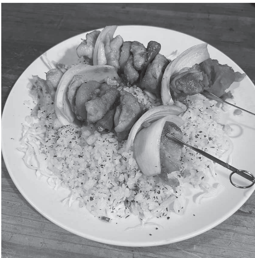
▲ケンタッキー on Top (スープ付)