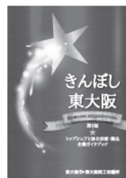
▲写真はきんぼし東大阪第6版