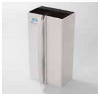
ペーパータオルホルダー

時代のニーズを先取りし、常に柔軟な発想と、斬新なアイデアのもと事業を展開しており、今後も業界のリーディングカンパニーとしての活躍が期待される。