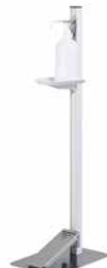
足踏式消毒液スタンド