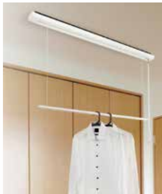
昇降式室内物干し