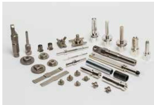
電気自動車(EV)部品及びハイブリット自動車(HEV)部品

永年にわたり培ってきたこれらの技術や設備を使い分け、また組合せることによって様々なパーツを効率よく、経済的に量産。総合パーツメーカーとして、今後も顧客から信頼されるメーカーとして、同社は独自の技術力と柔軟な発想で新しい時代に応えるモノづくりを追求し、さらなる飛躍を目指し挑戦しつづける。