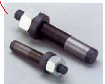
鉄骨接合法用ハック高力ワンスイドボルト